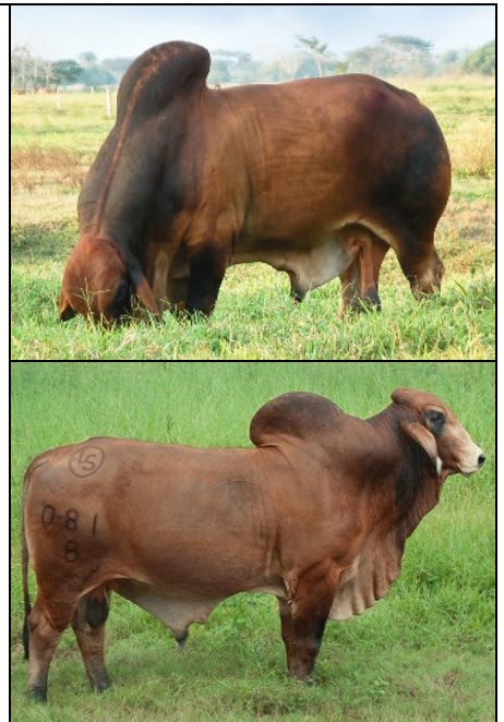
Photos: père Monterrey Remedy José 726/7 (arriba) – GPM El Caney Singin Palmar 081/8 (abajo)

La genealogía del (a) presente T O R O ha sido aceptada para registro en los libros genealógicos de ganado cebú, de acuerdo con los Estatutos y Reglamentos de la Asociación Colombiana de Criadores de Ganado Cebú.