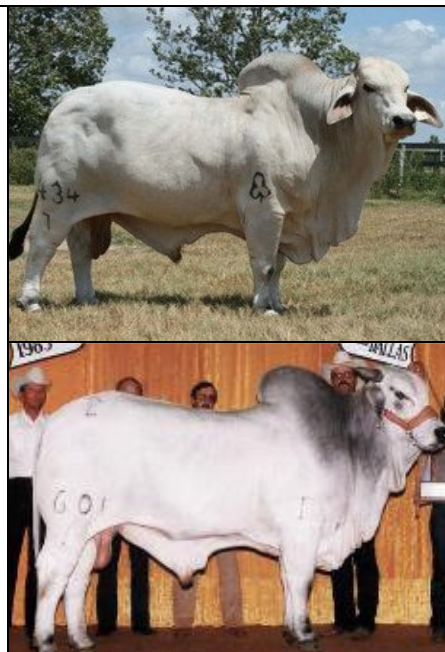
Photos: père JDH SIR LUIGI MANSO 434/7 (haut) – arr. grd père mat. JDH ATARI MANSO 601/1 (bas)

La genealogía del (a) presente T O R O ha sido aceptada para registro en los libros genealógicos de ganado cebú, de acuerdo con los Estatutos y Reglamentos de la Asociación Colombiana de Criadores de Ganado Cebú.